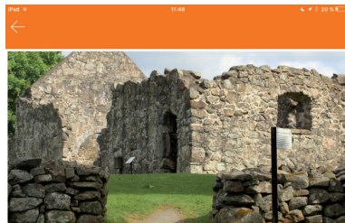
The ruin of the old Romanesque church in Rya The ruin of the old Romanesque church in Rya south of Örkelljunga is a great place to visit if you want to feel the wings of history. The church was founded at the end of the 12th century and the beginning of the 13th century. Nowadays weddings and concerts are popular events during the summer season.