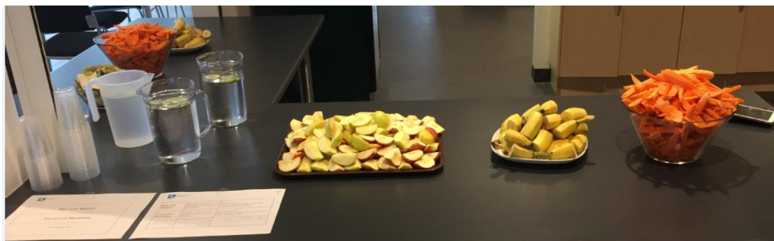
Frukt och grönt.

Det fanns en station där barnen kunde utöva fysisk aktivitet, det bjöds på grönsaksstavar och framför allt gavs besökarna en möjlighet att få information om Hälsoförskolan och öppna upp en dialog om hur man kan arbeta för att öka barns hälsa. De två arkitekter som engagerats i projektet var på plats och presenterade sina konceptförslag för besökarna. Studenter från Malmö högskola visade upp resultatet av fem st. designidéer bl.a. en pulsmätare för barn samt en interaktiv vägg.