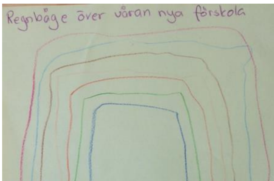
En regnbåge över förskolan.