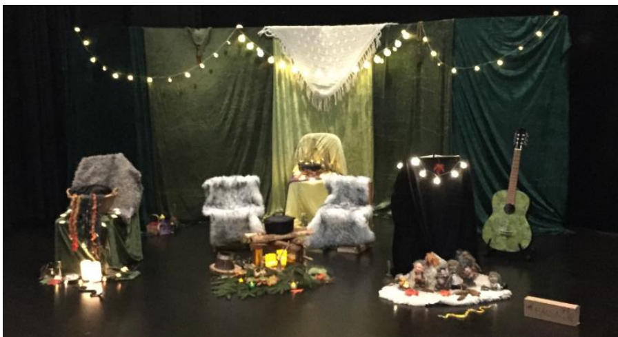
Sång- och sagostund i Sparbanken Boken Blackbox.

Det arrangerades i samband med detta en mycket uppskattad sång- och sagostund.