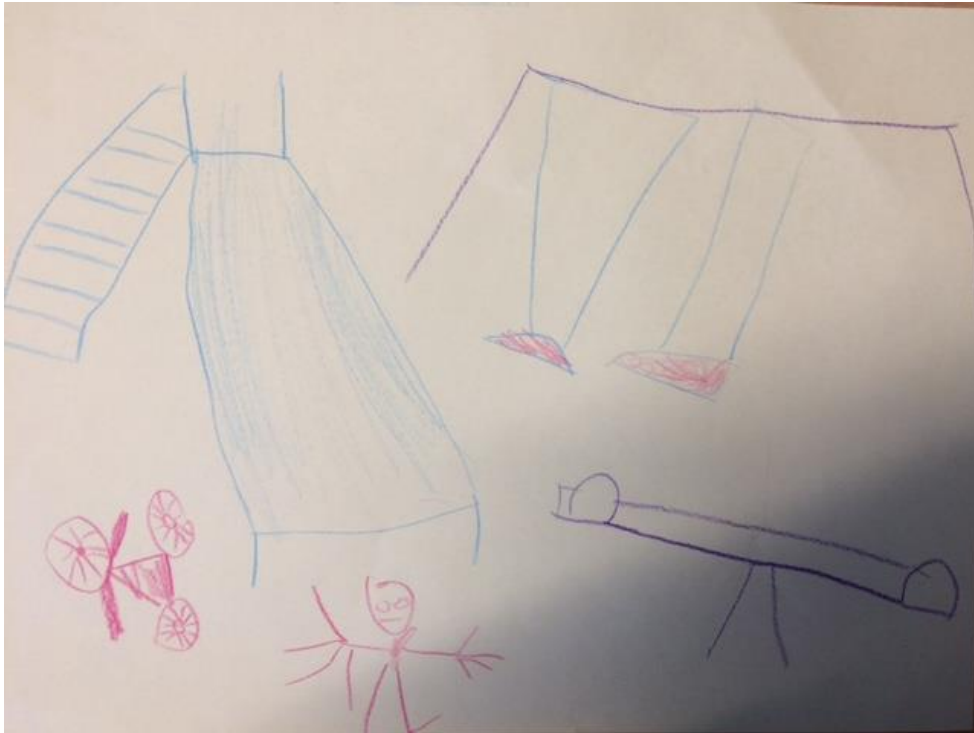
Ett barns bild av en hälsoförskola.

Resultatet av workshoppen redovisas i sin helhet i dokumentet Workshop 2 Hälsoförskolan 16 mars 2017 (sammanställningen har även varit tillgänglig för allmänheten på biblioteket), nedan följer några tydliga exempel: