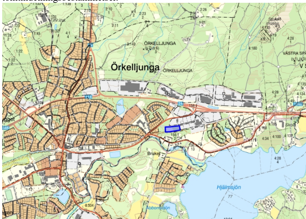
Fastigheten Städet 1 markerad med blått.

Den 21 maj 2024 inkom ansökan om planbesked gällande fastigheten Städet 1 i Örkelljunga. Ansökan avser endast upphävande av tomtindelningsbestämmelser.