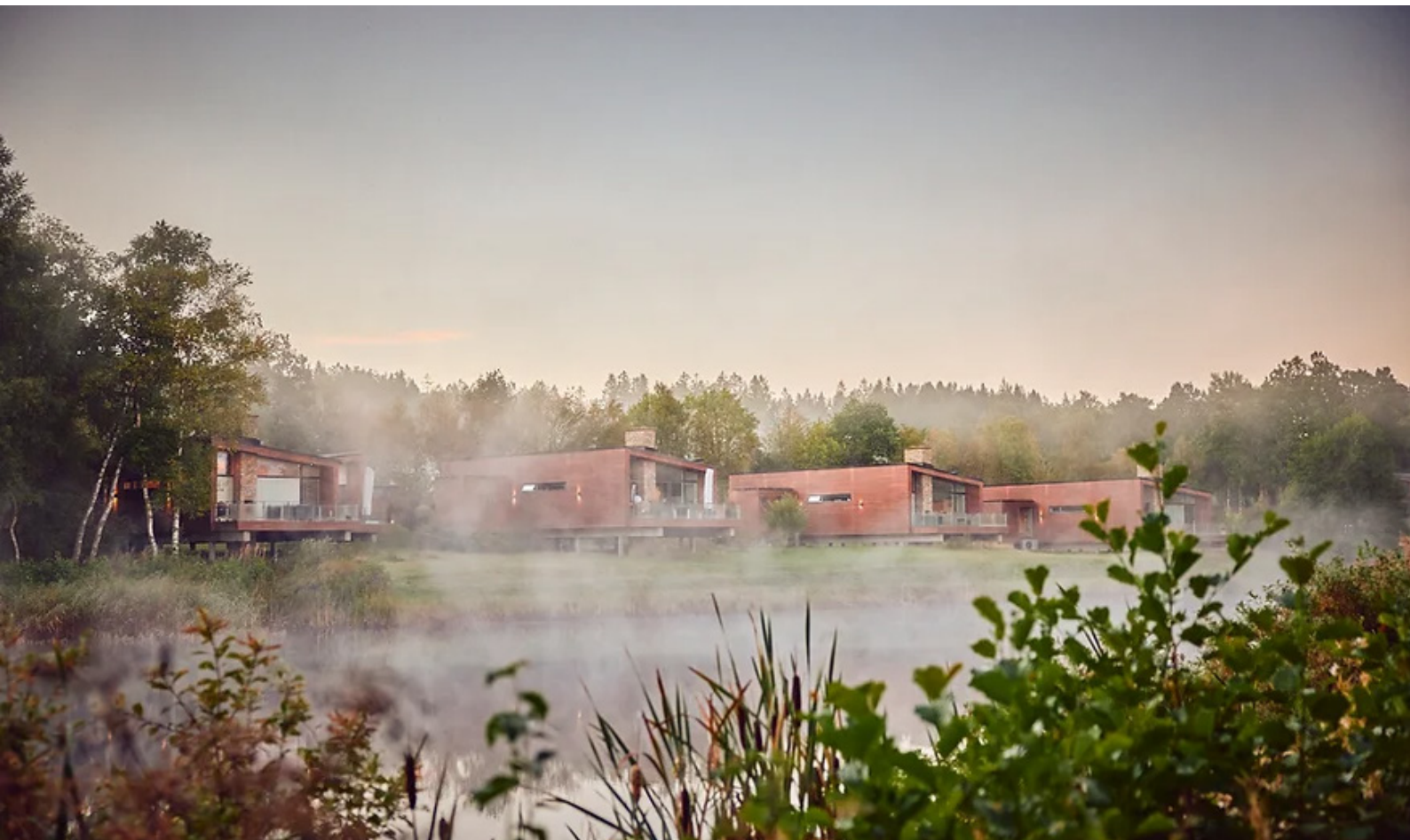
Livsstilshus på Woodlands Country Club. (Henning Larsen Architects AB, 2009)