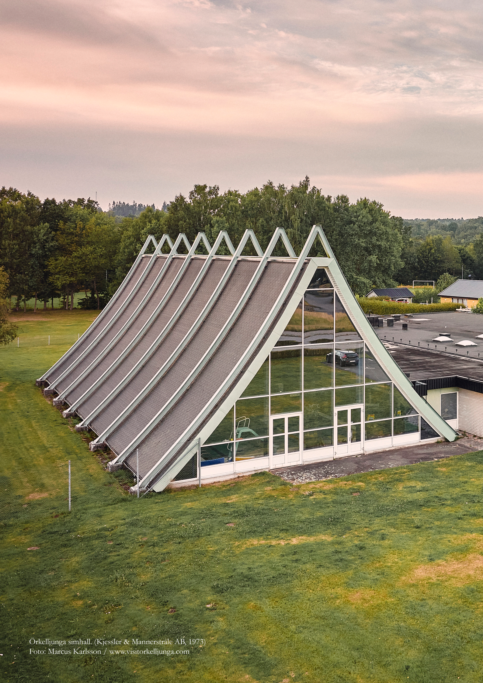
Örkelljunga simhall. (Kjessler & Mannerstråle AB, 1973)