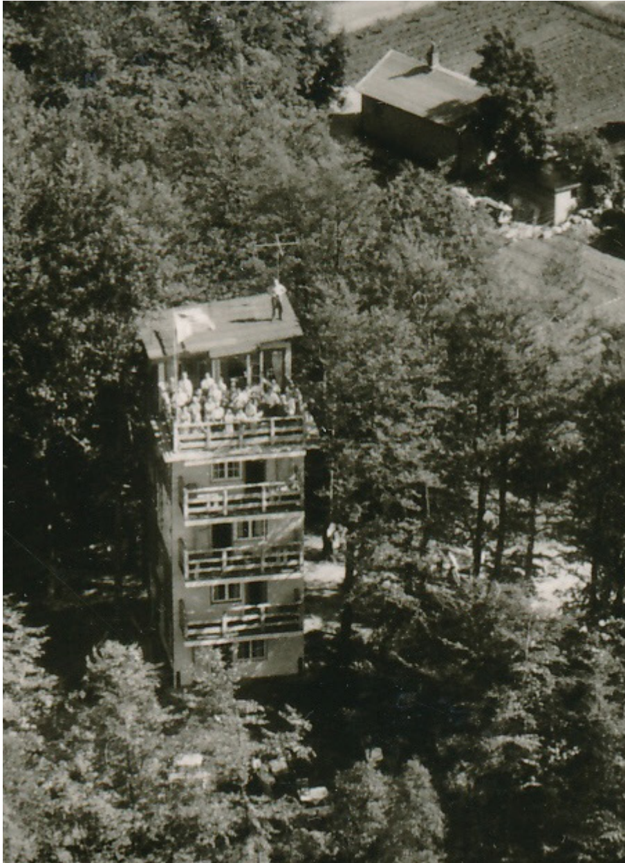
Det annorlunda femvåningshuset i Fasalt, uppfört under 1950-talet, ligger inbäddat i grönska, med milsviid utsikt över Hallandsåsen.

Kanske handlar det på platsen om att bygga något som blir ett blickfång i en siktlinje? Eller kanske det handlar om att ta upp en kulör i omgivningen, en takvinkel eller en fasadlinje? Smälta in eller sticka ut? Båda kan vara rätt - men det ska inte vara slumpen som avgör, det ska vara en medveten gestaltning!