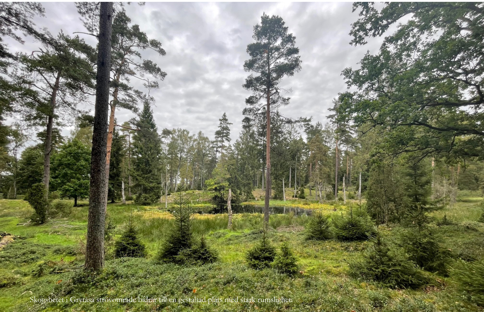
Skogsbetet i Grytåsa strövområde bidrar till en gestaltad plats med stark rumslighet.

Vi bidrar alla till att skapa platserna där våra liv pågår och vi har olika roller i platsskapandet. Platsen gränsas av väggar, golv och tak. Ett torg i en stad. En glänta i en granskog. En strand vid en sjö. Rumsligheten kan vara stark eller svag, rummet kan vara litet eller stort, men det är rummet som är platsen.