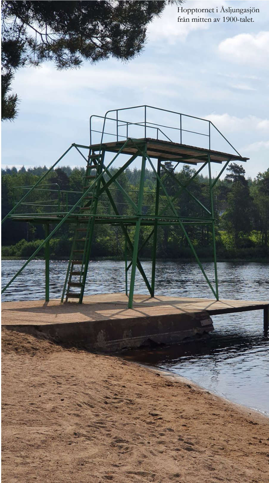
Hopptornet i Åsljungasjön från mitten av 1900-talet.