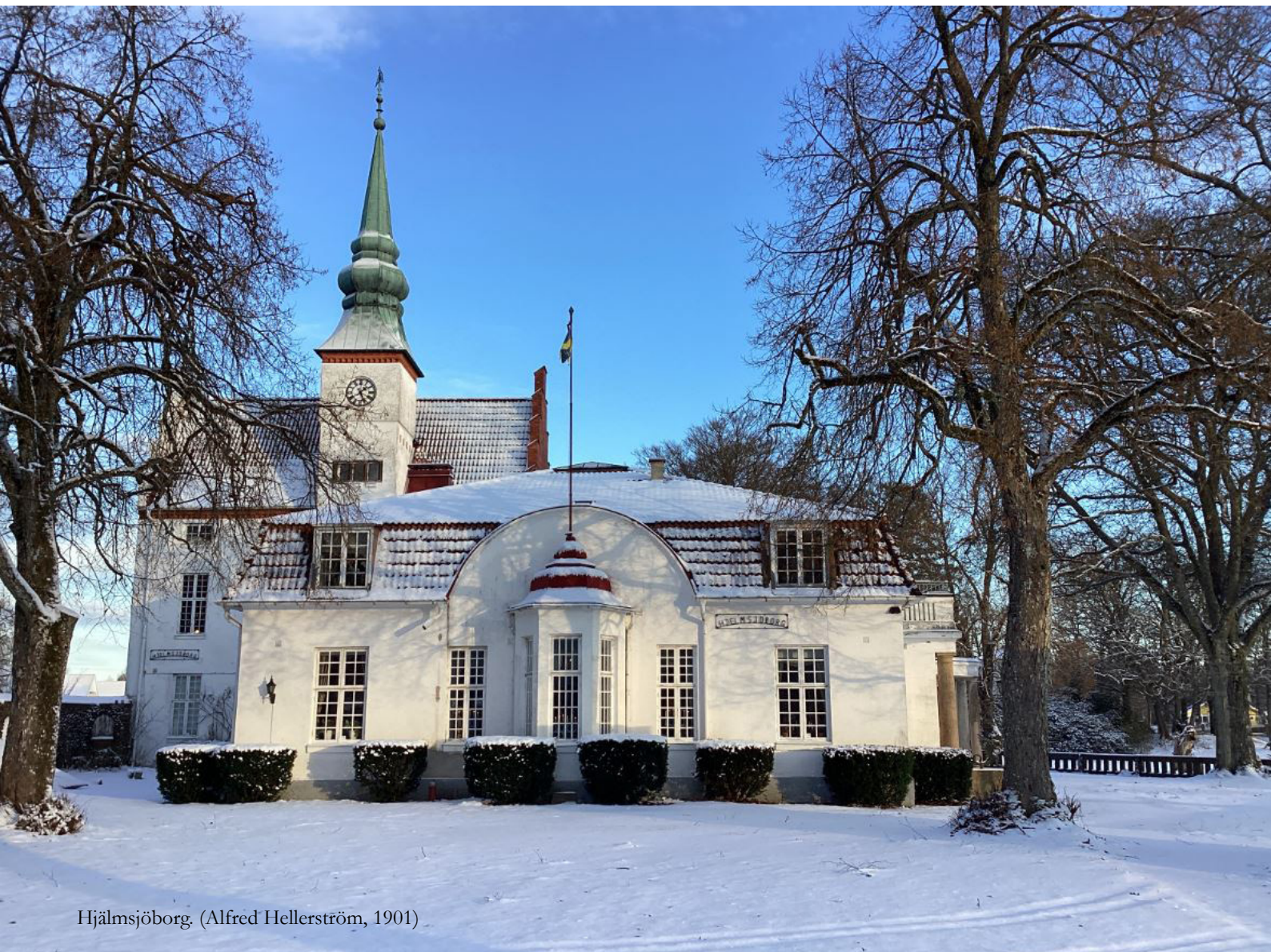
Hjälmsjöborg. (Alfred Hellerström, 1901)