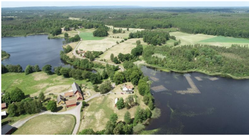
Idylliska Krängelbygget, mellan Gårdsjön och Vita Sjö.

Målbilden och visionen för landsbygden och landsbygdens byar finns uttryckt i översiktsplanens kapitel ”Utvecklingsinriktning”. Här beskrivs att det utanför de fyra bykärnorna finns en sprudlande landsbygd med idylliska boendemiljöer, som är värdefull och en förutsättning för kommunens utveckling. På landsbygden finns ett 80-tal byar. I kulturmiljöprogrammet för Örkelljunga kommun ( www.orkelljunga.se/kulturmiljo ) finns bra bakgrundsinformation som är relevant för arkitekturen på landsbygden. Texten i detta avsnitt refererar till vårt kulturmiljöprogram.