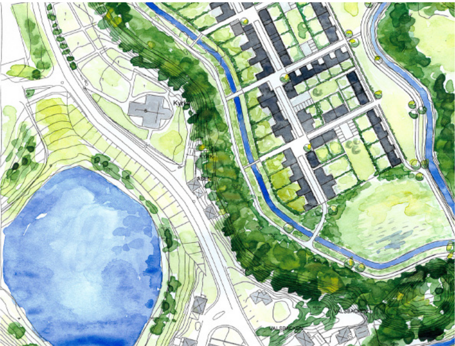
Utsnitt ur illustrationsplan över Ejdern i Örskelljunga. (Bjartmar & Hylta Arkitekter, 2006)