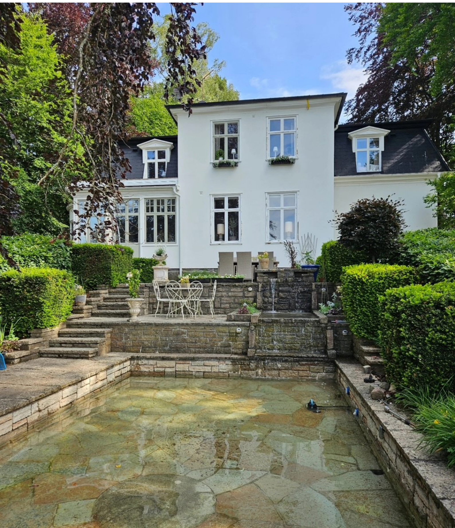
Villa Tallbacka i Örskelljunga blev vinnare av miljö- och byggnadspriset 2024.