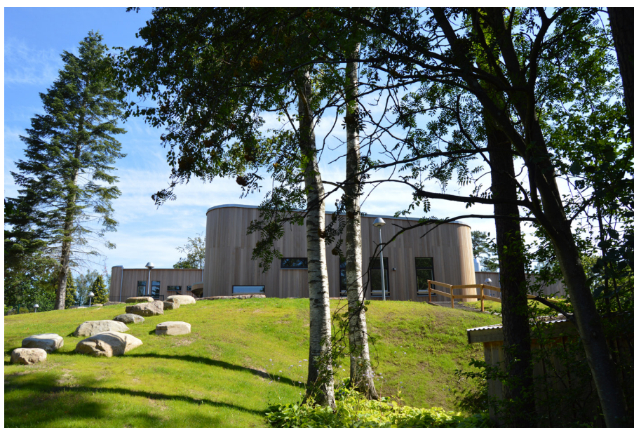
Förskolan Högekullen är ett gott exempel på anpassning till platsen. Byggnaden är både stolt och ödmjuk och lyfter hela området. (Chroma Arkitekter, 2019)

Blandstaden är ett planeringskoncept som blivit vår tids ideal inom stadsplanering. Vi vill inte bygga segregerat (ett exempel på funktionsseparerad stadsplanering är miljonprogrammet). Blandstaden är en reaktion mot de zonerade städer som det tidigare planeringsidealet har gett upphov till och som vi idag ser stora nackdelar med. Principen med blandstaden innebär att bygga en mosaikstruktur med mångfald.